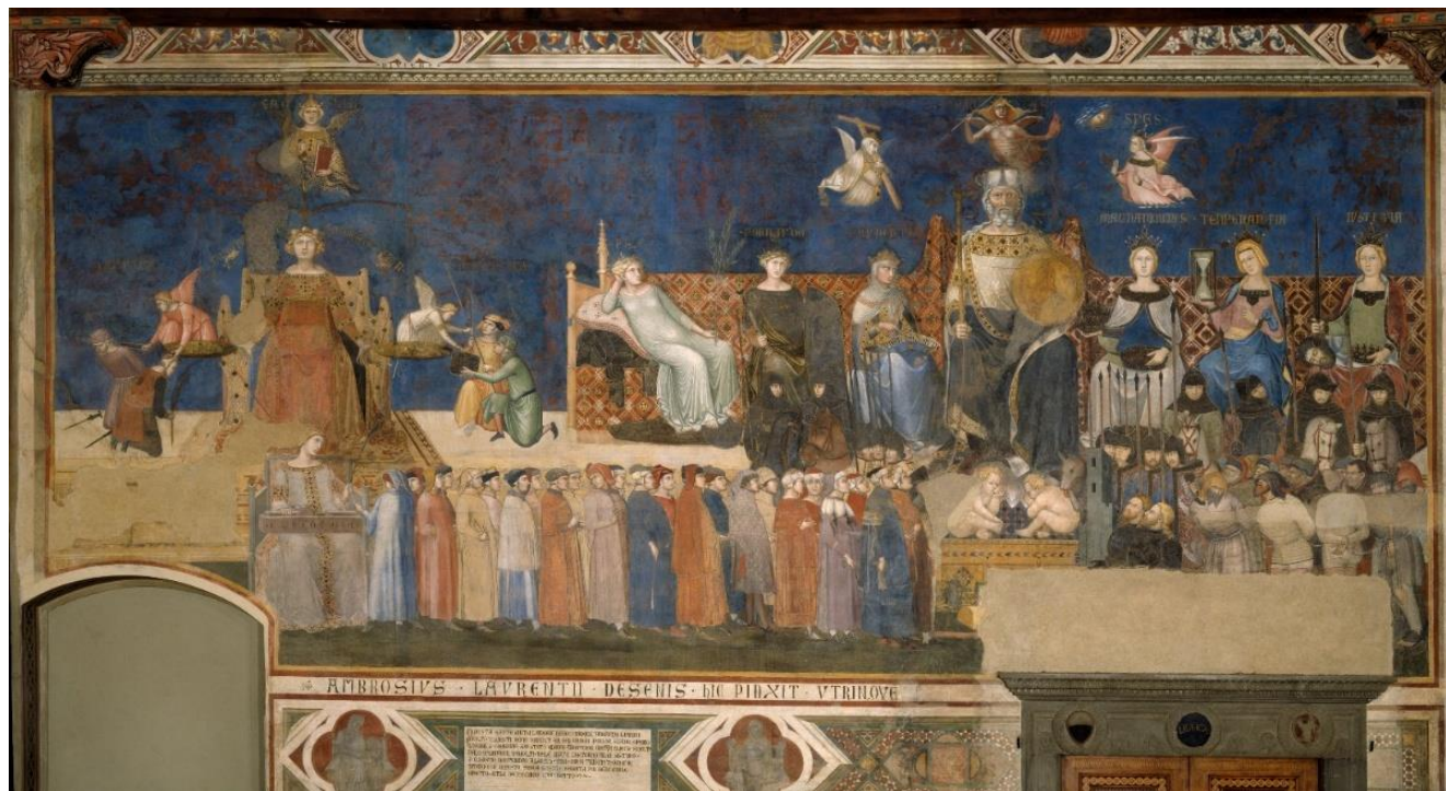
Allegoria del buon governo, Ambrogio Lorenzetti (1338-1339)