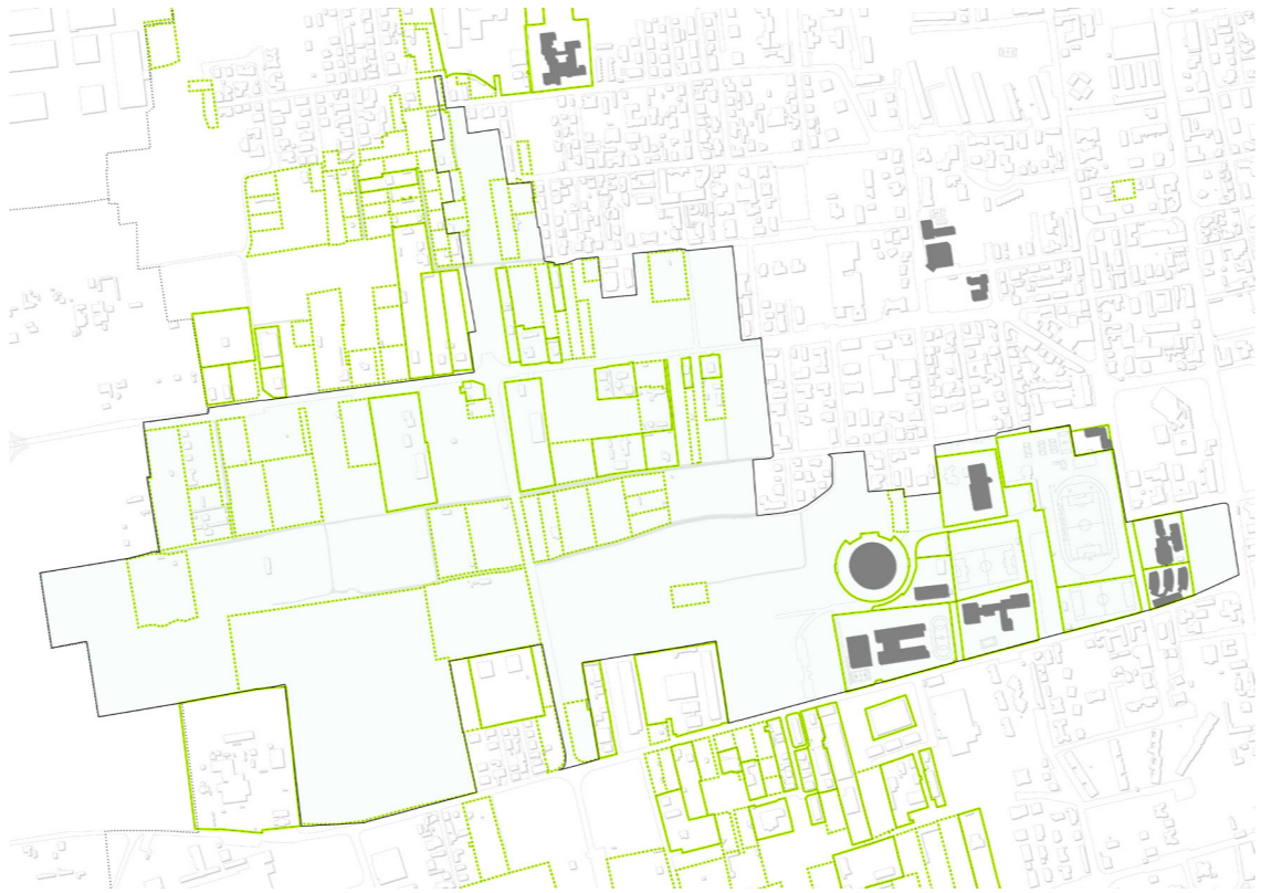
Riforma dei recinti E' necessaria una riforma delle recinzioni che prevede in alcuni casi la loro rimozione e in altri casi la loro ridefinizione in continuità con il paesaggio circostante.