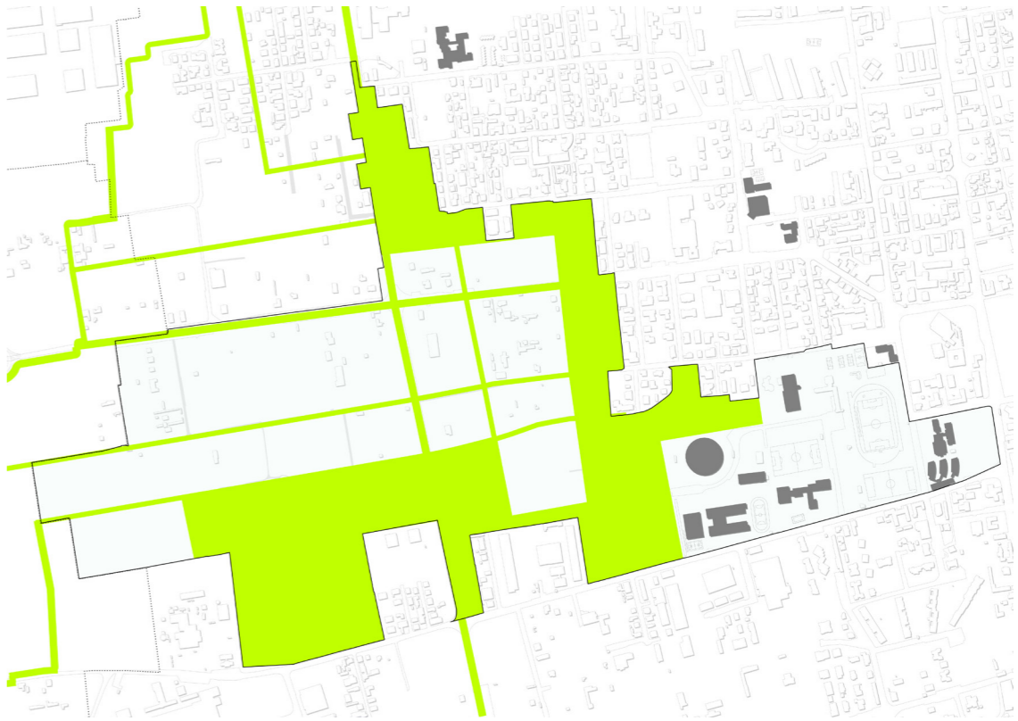
Vegetazione Gli elementi su cui ruota il progetto sono sostanzialmente tre: un sistema articolato di filari; un sistema di macchie arboree ed un sistema di boschi.