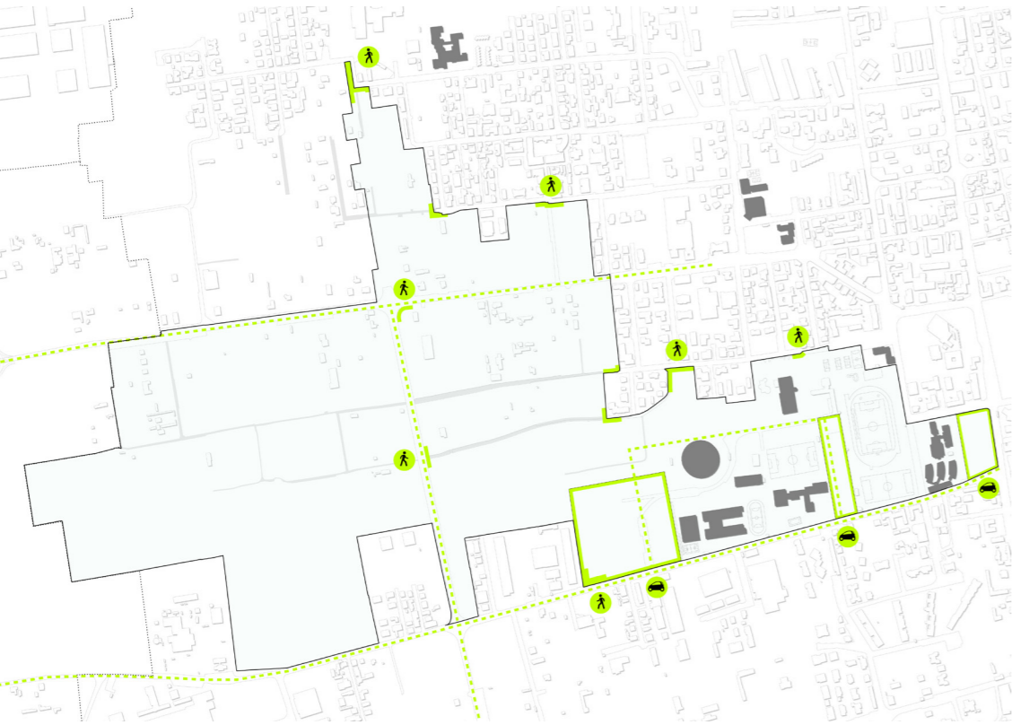
Accessibilità e sosta I punti di accesso del Parco sono infrastrutture leggere, muri di legno, con sedute e porta bici, segnalati mediante interventi di infografica. Il sistema dei parcheggi viene completamente ricalificato e potenziato.