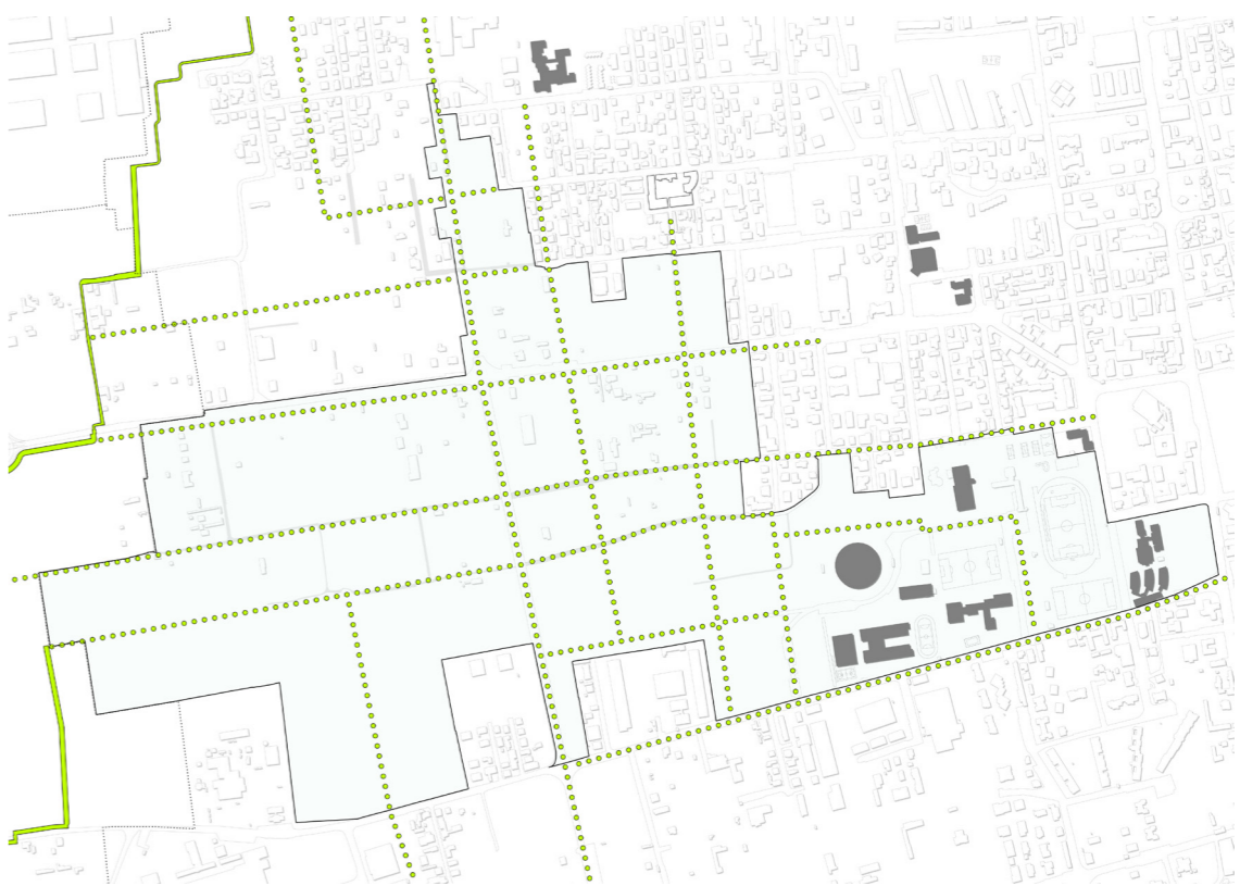
Relazioni e connessioni Un sistema di percorsi assicura la massima accessibilità pedonale e ciclabile al parco, attraverso una rete di tracciati che divide lo spazio in diversi ambienti.